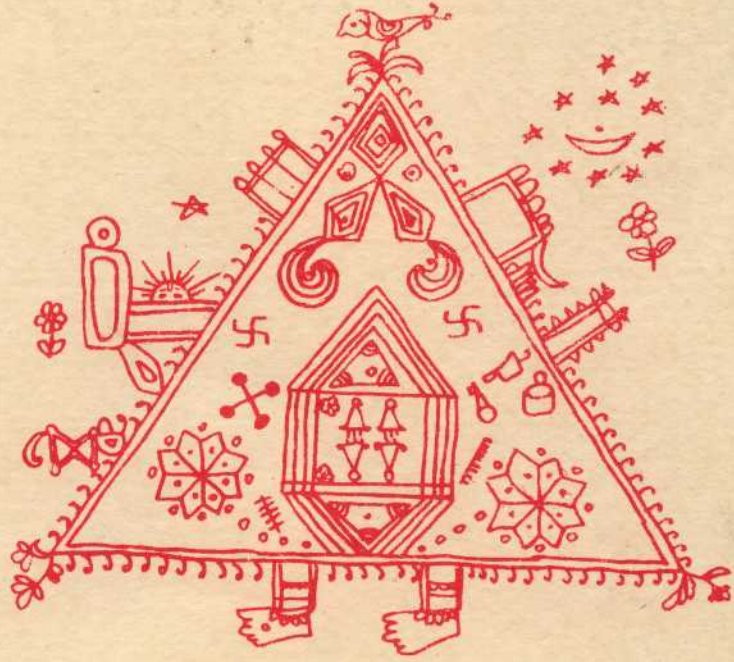
सांझी पर्व का मांडणा

रचें खुद हम अपना ज्ञान पुख्ता हो अपनी पहचान